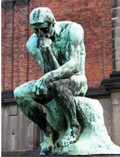
El pensador.

Ser libre no significa hacer todo lo que se quiere: una persona es plenamente libre cuando es capaz de elegir, después de analizar detenidamente lo que más le conviene, tomando en cuenta las limitaciones que tiene, así como las consecuencias (tanto buenas como malas) que acarrearán sus acciones.