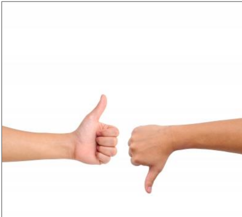
Aprobación y desaprobación

García, L. (2006). Unidad II, Cap. 3. Ética o Filosofía Moral p. 54-57. México: Trillas.