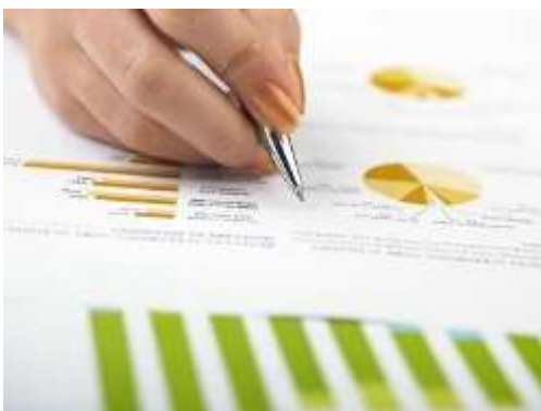
Análisis de datos estadísticos.