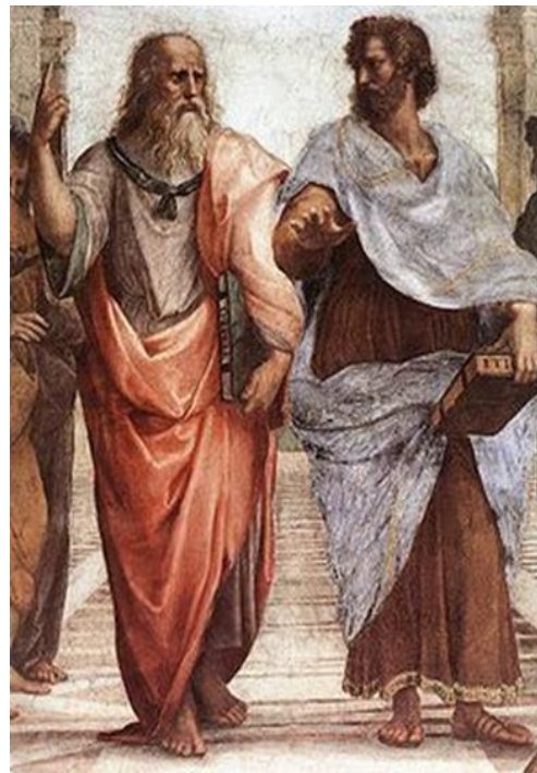
Ilustración 2. Sanzio R. (1509). Platón y Aristóteles

A lo largo de diferentes períodos de la historia, eruditos sentaron el precedente de las ciencias actuales a través de la investigación. Esto significa que observaron, reflexionaron críticamente, plantearon procedimientos ordenados y estructurados que les permitieron descubrir hechos, datos, relaciones o leyes en diferentes campos del conocimiento (Ortiz, 2005).