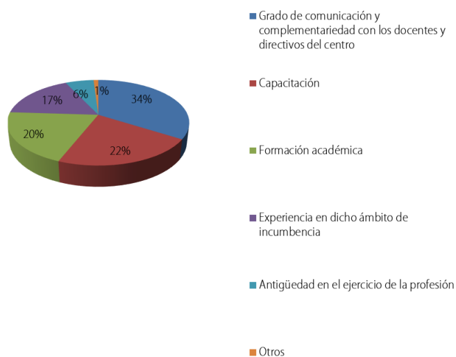
Figura 2 Factores que influyen en la PE escolar (en porcentajes)

Respecto de la participación del docente en la PE, el 80% de los encuestados respondió afirmativamente. En este sentido, los docentes se perciben implicados en el proceso de PE principalmente como agentes partícipes de una demanda puntual de intervención y también como agente complementario del psicopedagogo al realizar abordajes institucionales (Tabla 4).