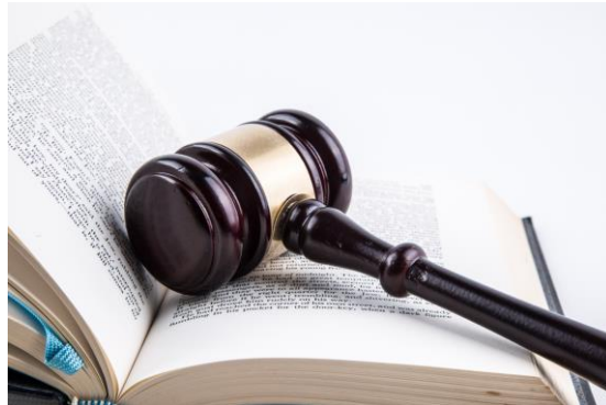
Elementos y funciones del Estado