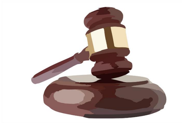
Derecho Procesal

En la vida cotidiana o a través de los medios de comunicación, probablemente has escuchado expresiones tales como “iniciar proceso judicial en contra de...”, “se dictó auto de vinculación a proceso por el delito de...”, entre otras. ¿Te has preguntado qué significa la palabra proceso en el lenguaje jurídico?