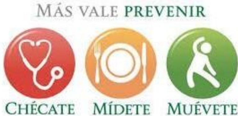
Figura 6. Campaña de promoción en salud. México.

La promoción de la salud es especialmente útil en comunidades que tienen una menor accesibilidad a los recursos públicos de salud y una menor disponibilidad de apoyo socioeconómico. Las minorías que viven en un entorno rural pueden experimentar aislamiento social y geográfico, y sufrir marginación cultural y política (Holgado, Maya y Ramos, 2012).