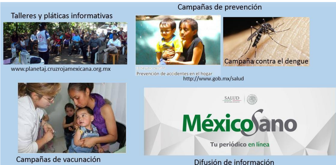
Figura 4. Instrumentos de prevención en salud.