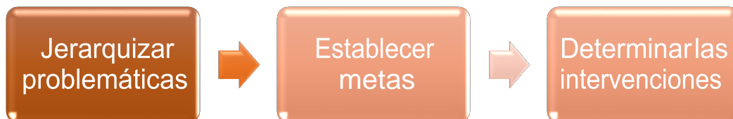
Figura 3. Actividades de la Planificación. UnADM