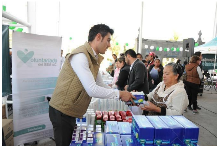
Figura 5. Promoción en salud.

La promoción de la salud es la encargada de fortalecer la salud de las persona a través de acciones que eviten las enfermedades a través del fomento de hábitos de vida saludable.