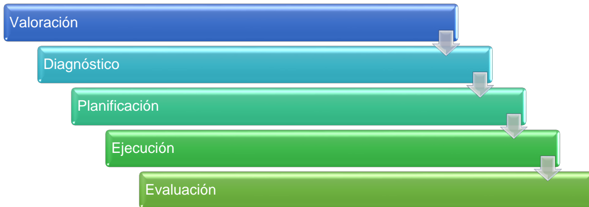
Figura 2. Fases de la prevención en salud. UnADM