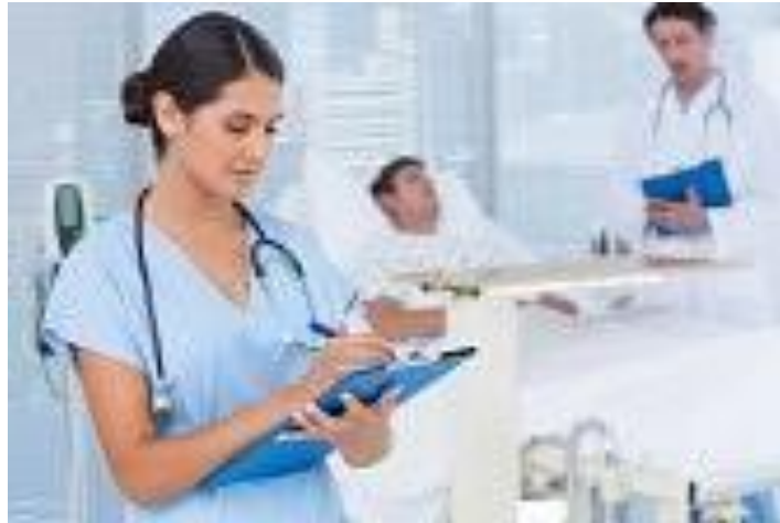
Figura 7. Atención a la salud.

Hace referencia a las acciones sistemáticas en las que una persona recibe los cuidados necesarios para atender un padecimiento o más. Son aquellos servicios profesionales en favor de la atención a las necesidades de atención de una persona o población a través de cuidados y estrategias específicas.