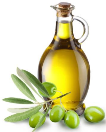
Figura 3. Aceite de oliva