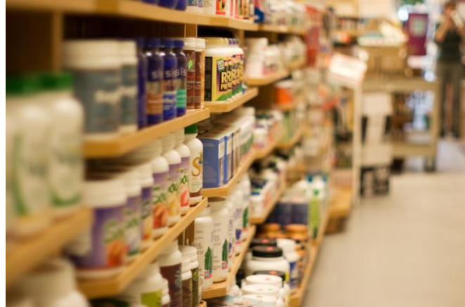
Figura 24. Suplementos alimentarios

Su presentación en el mercado es, por lo regular, en forma de cápsulas o líquidos y, como su nombre indica, son complementos y, por ende, no sustituyen un tiempo de alimentación o un régimen.