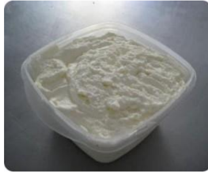
Figura 5. Nata

de lípidos, pero puede oscilar entre 18 y 50 o más. Se denomina crema de leche si la forma de presentación es líquida.