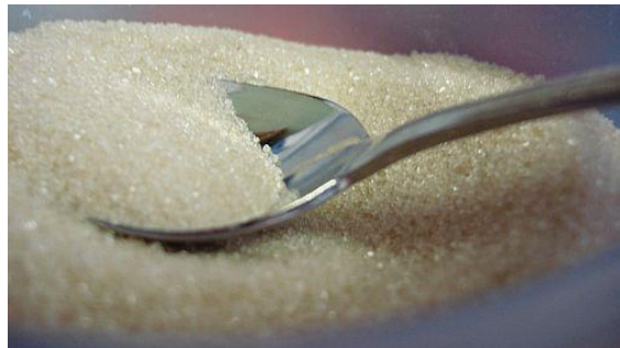
Figura 10. Azúcares

La caries infantil, es un padecimiento odontológico, el cual se ha correlacionado con su consumo, debido a la capacidad del azúcar de formar e iniciar la lesión o placa dentaria.