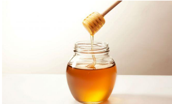
Figura 11. Miel