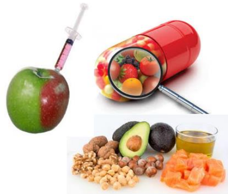
Imagen. Alimentos: Grasas, funcionales y transgénicos