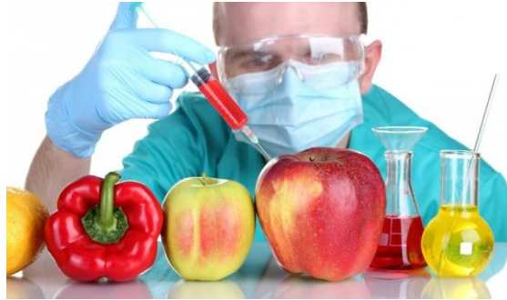
Figura 20. Alimentos transgénicos

Así también, la biotecnología ha permitido eliminar las barreras sexuales en la transferencia genética y, actualmente, se puede introducir genes a pesar de su distancia filogenética.