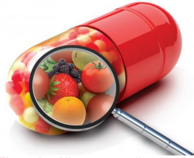
Figura 25. Alimentos medicamentos

convencional; a esto se debe su nombre, pues son considerados a veces como un medicamento.