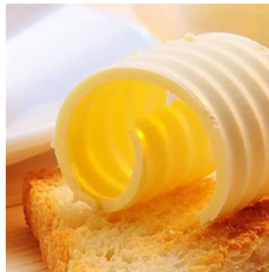
Figura 6. Mantequilla

A partir de la nata se obtiene un producto semisólido llamado mantequilla, previa a un proceso de maduración, batido, lavado y amasado. Contiene alrededor de 80 a 85 g de lípidos por cada 100 g, así como vitaminas A y D. Es rica en colesterol (250 mg por 100 g).