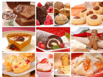
Figura 12. Galletas y pasteles

Nutricionalmente, en su contenido abundan los hidratos de carbono (como el almidón y sacarosa), con un contenido muy inconstante en la cantidad de lípidos. Este tipo de alimentos con alta densidad energética no deben sustituir a la fruta fresca como postre, ya que el abuso en su consumo puede significar un exceso calórico en la dieta. De cierta manera, un consumo moderado y ocasional no refiere inconvenientes y puede complementar y alegrar el menú de una festividad.