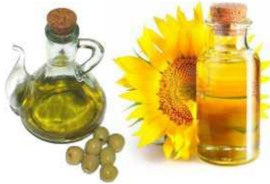
Figura 2. Aceites