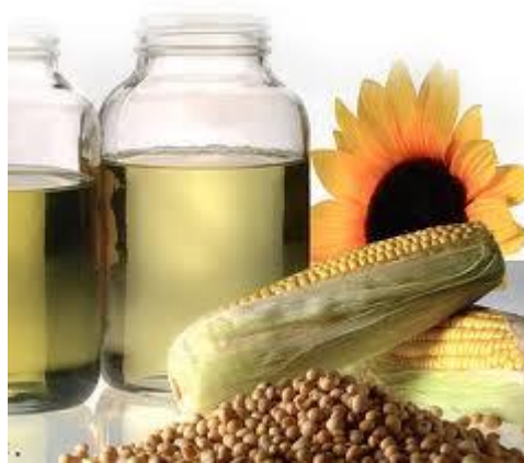
Figura 4. Aceite de semillas

Estos aceites se obtienen del girasol, la soya y el maíz, principalmente, para diferenciarlos del de oliva. En su composición media, similar en los tres, se encuentra un predominio (50 % o más) de ácido linoleico, así como, una cantidad discreta de ácidos grasos saturados y de ácido oleico. Son grasas al 100%. Su alto contenido en ácido linoleico hace que estos aceites se incluyan en ciertas dietas terapéuticas.