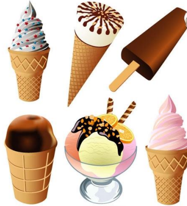
Figura 14. Helado

con otros productos alimenticios como azúcar, cacao, frutas, huevos y agentes aromáticos, dependiendo de las características de cada producto. El alimento resultante tiene una elevada densidad calórica debida, sobre todo, a los lípidos constituyentes.