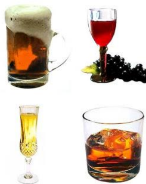
Figura 16. Bebidas fermentadas

Son bebidas resultado de la fermentación de algún alimento, por ejemplo, el vino es el producto resultante de la fermentación de la uva, el cual contiene azúcares simples y alcohol en una proporción de 10 a 15 %. La cerveza es obtenida a partir de la cebada, a la que se añade lúpulo, el cual le confiere su sabor característico. La sidra es producto de la fermentación de las manzanas.