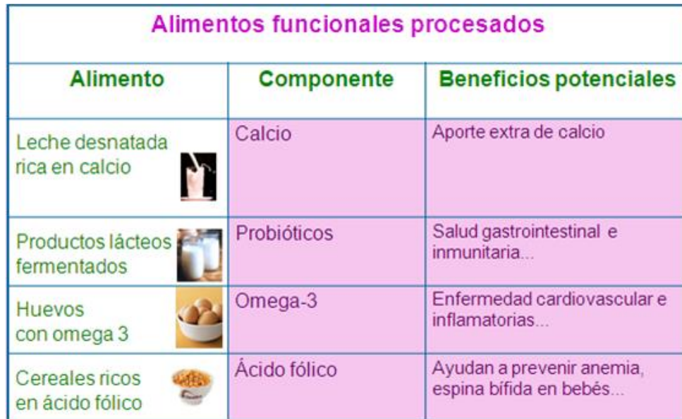
Figura 22. Alimentos funcionales procesados