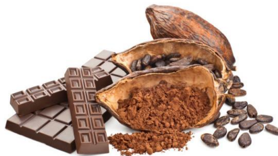
Figura 13. Cacao y chocolate

El chocolate es entonces un alimento energético., se utiliza básicamente en pastelería, como golosina, saborizante, edulcorante. Actualmente el cacao sin azúcar adicionada es una buena opción como chocolate amargo para las personas con Diabetes Mellitus. En el caso de los niños, resulta ser un estímulo para ingerir las raciones diarias de leche recomendadas, que, sin su agradable sabor del cacao, se evitarían.