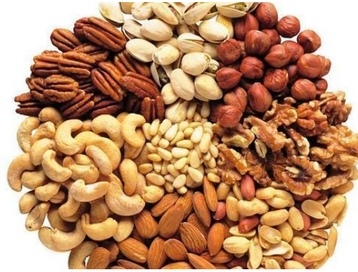
Figura 9. Frutos secos grasosos

El grupo de las grasas dentro de la cultura mexicana suele jugar un papel importante, ya que su inclusión en diferentes recetas es imprescindible, como por ejemplo en el Tamal, el cual es un alimento de fácil acceso, aunque en su preparación se incluya la manteca de cerdo como ingrediente.