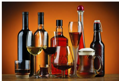
Figura 15. Bebidas alcohólicas

Hablando desde el punto de vista de su composición, el porcentaje en volumen de alcohol etílico de una bebida determinada se expresa en grados. Para pasar a gramos, debe multiplicarse por su densidad (0.789). Así, por ejemplo, un litro de vino de 12° contiene 120 mL de alcohol, o, lo que es lo mismo, 94.68g. Según lo cita Cervera en Alimentación y Dietoterapia.