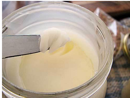
Figura 8. Grasas animales

Puede haber sido deshidratada, y entonces es grasa pura al 100 %. Es rica en ácidos grasos (saturados e insaturados) y en colesterol, característicos de su origen