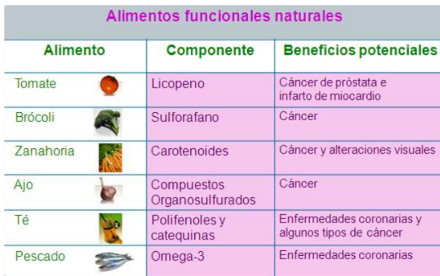
Figura 21. Alimentos funcionales naturales

A continuación algunos ejemplos de alimentos funcionales: