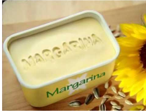
Figura 7. Margarina