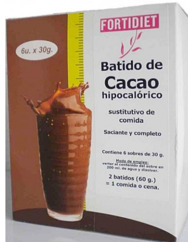
Figura 23. Alimentos nutricéuticos.