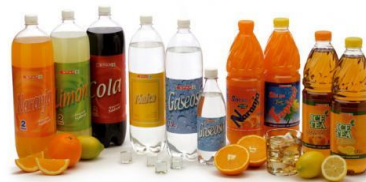
Figura 19. Bebidas refrescantes

Cuando son ingeridas ocasionalmente y con moderación, las bebidas refrescantes pueden considerarse inocuas, contrariamente a lo que sucedería cuando su uso excesivo supera dicha recomendación moderada, lo cual puede conducir al consumo innecesario de aditivos y de energía sobrante. Es importante recalcar que la única y verdadera bebida refrescante es el Agua potable.