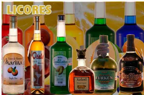
Figura 17. Licores

El proceso de destilación es una operación que consiste en transformar un líquido en vapor, condensarlo luego y recoger el líquido resultante. Desde el punto de vista de la nutrición, puede decirse que las bebidas alcohólicas proporcionan la energía procedente de las 7 kcal x g de alcohol etílico, a las que deben sumarse las procedentes de los azúcares del producto de origen. Cita: Cervera. Alimentación y Dietoterapia.