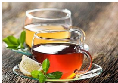
Figura 18. Bebidas estimulantes

Existen ya bebida de cola y cafés sin cafeína, que pueden ser adecuadas para algunas personas que así lo requieran.