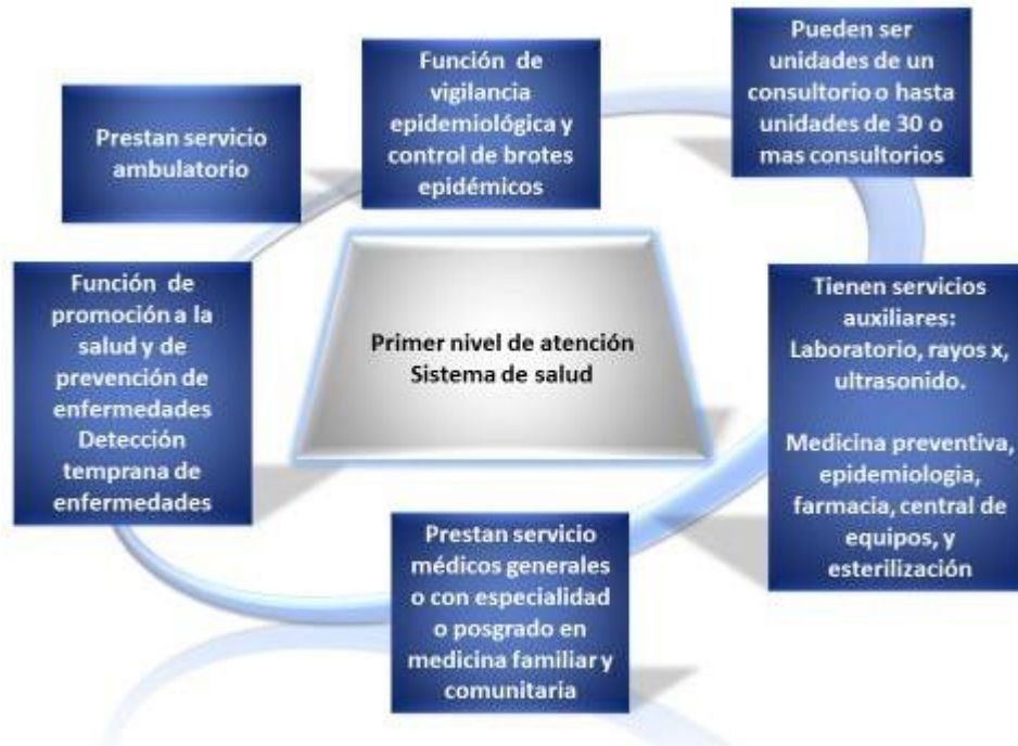
Figura 6. Representa al primer nivel de atención protección, características y servicios que presta

El primer nivel de atención lo forma una red de unidades médicas que atienden a nivel ambulatorio. Son el primer contacto del usuario con el sistema formal de atención. Estas unidades pueden tener distinto tamaño y variar en su forma de organización. Van desde unidades de un solo consultorio (muchos consultorios rurales e incluso urbanos de la Secretaría de Salud (SS) o del IMSS Oportunidades), hasta unidades con 30 o más consultorios y servicios auxiliares tales como laboratorio, rayos X y ultrasonido, medicina preventiva, epidemiología, farmacia, central de esterilización y equipos, administración, aulas, etc. En la SS están divididos según tamaño en TI, TII y TIII, siendo los más grandes estos últimos. En las unidades del primer nivel prestan servicios médicos generales con licenciatura o con estudios de especialidad en o posgrado (medicina familiar y comunitaria), así como enfermeras y técnicos. Trabajan también médicos pasantes (que en el caso del IMSS oportunidades son la mayoría del personal médico). La mayoría de las consultas médicas que se otorgan en el país corresponden a las realizadas por los médicos generales quienes resuelven una gran cantidad de problemas de salud sin