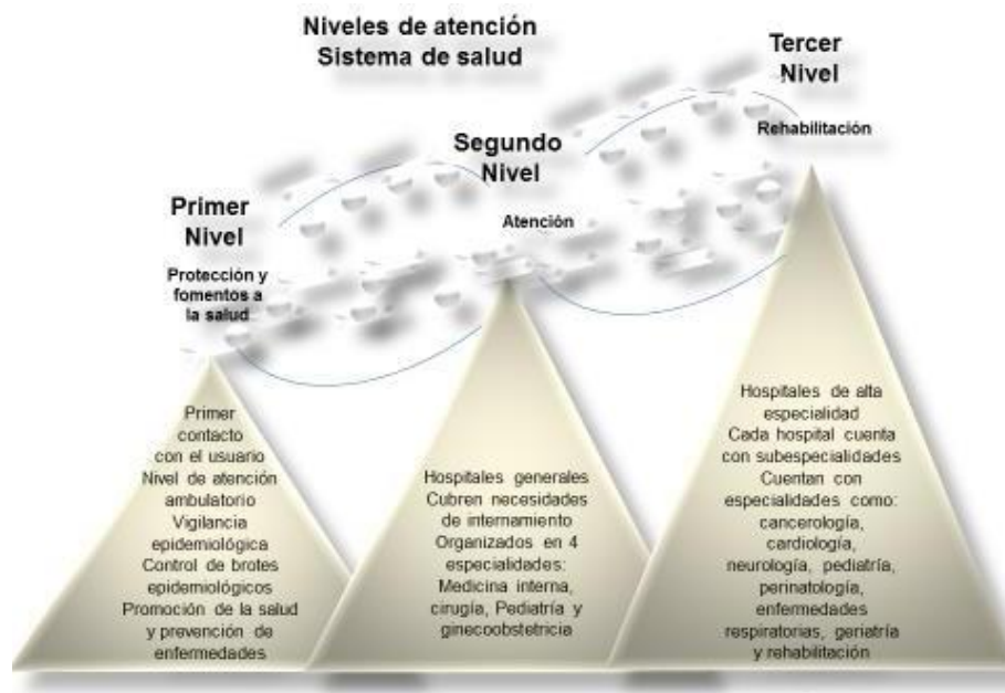
Figura 5. Representa a los tres niveles de atención protección, atención y rehabilitación en que se divide el sistema de salud en México

El sistema de salud en México está estructurado funcionalmente en tres niveles de atención. Cada uno de los tres sectores de antes descritos cuenta en distinta proporción con unidades de atención que a continuación se describirán.