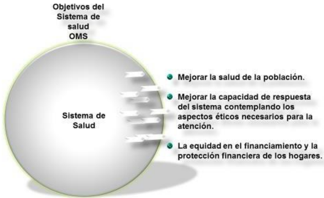
Figura 3. Muestra los principales objetivos del sistema de salud (OMS)