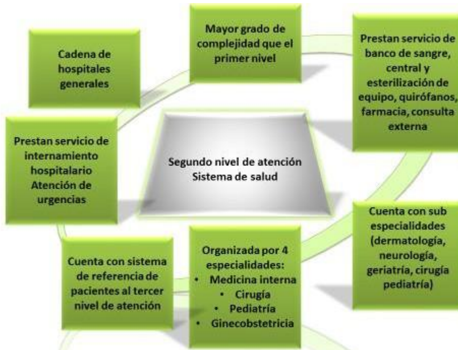
Figura 7. Representa al segundo nivel de atención protección, características y servicios que presta