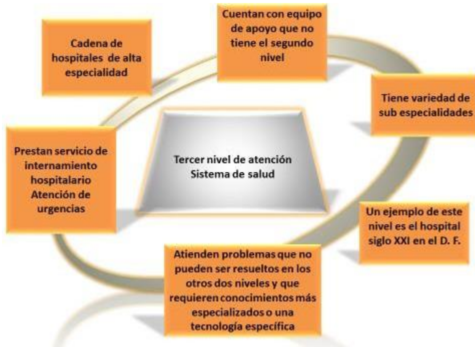
Figura 8. Representa al tercer nivel de atención protección, características y servicios que presta

El tercer nivel de atención lo forma una red de hospitales de “alta” especialidad, en los cuales se encuentran subespecialidades y equipos de apoyo que no encontramos en el segundo nivel de atención. En este nivel el hospital puede tener muchas subespecialidades, por ejemplo existen las Unidades Médicas de Alta Especialidad del IMSS o el Instituto Nacional de Ciencias Médicas y Nutrición, o bien pueden ser especialidades en algún campo específico, como sucede con otros Institutos Nacionales de Salud, especializados en Cancerología, Cardiología, Neurología y Neurocirugía, Pediatría, Perinatología, Enfermedades Respiratorias, Geriátrica y de Rehabilitación. Muchos de ellos se encuentran saturados por que la demanda excede a la oferta de servicios haciendo que los pacientes tengan que realizar grandes periodos de espera a lo largo de su atención. Cabe señalar que en el campo de la Salud Pública existe también el Instituto Nacional de Salud Pública encargado de funciones de enseñanza e investigación en este campo. En este nivel se atienden problemas que no pueden ser resueltos en los otros dos niveles y que requieren conocimientos más especializados o una tecnología específica, en general costosa, que se concentra sólo en algunas unidades por razones de costo-beneficio. Una parte pequeña de los egresos hospitalarios corresponde a este tercer nivel de atención.