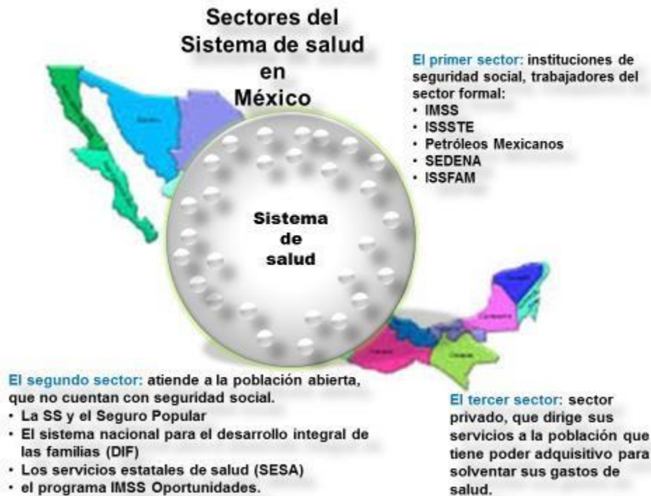
Figura 4. Representa al sistema de salud integrado por el sector de instituciones de seguridad social, sector de población abierta y sector privado.

Primer sector lo integran las instituciones de seguridad social, que prestan servicios a los trabajadores del sector formal de la economía y sus familias.