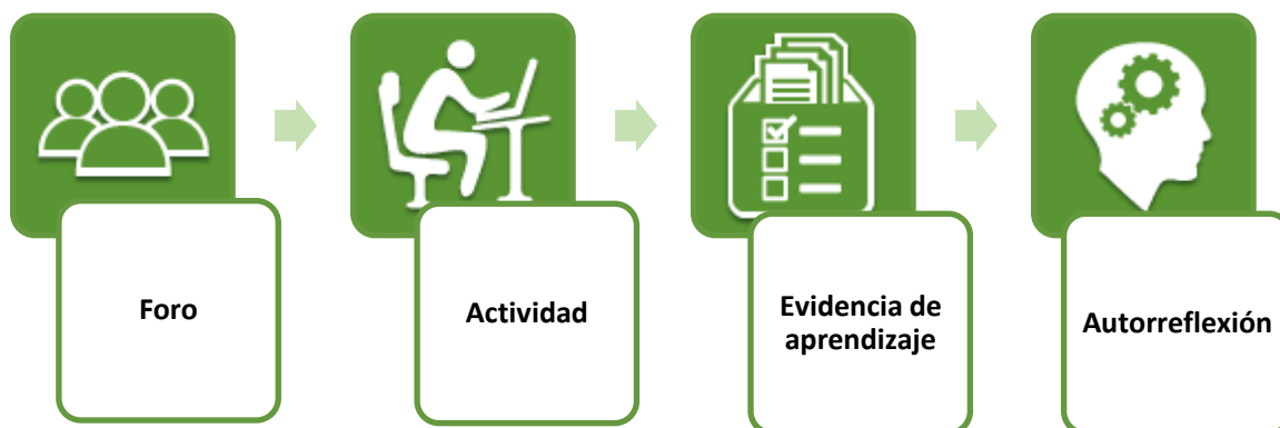
Ilustración 3. Dinámica de trabajo de la unidad 3.

De la misma manera que en la unidad anterior, todas las actividades son ponderables de acuerdo al esquema de evaluación de la asignatura. Además de no estar condicionadas las entregas.