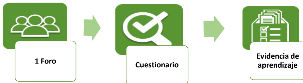
Ilustración 1. Dinámica de trabajo de la unidad 1.

La Evidencia de aprendizaje es la última actividad a realizar. Es importante señalar que ésta será retroalimentada y calificada una vez que el docente en línea ingrese al aula.